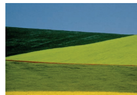
Franco Fontana, Basilicata, Italia, 1978, Tirage couleur