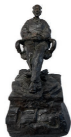
Rios n°1, 1998, sculpture en bronze